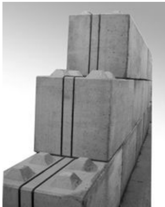
Foto: gestapelde blokken als kering