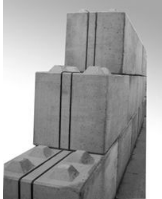
Foto: gestapelde blokken als kering